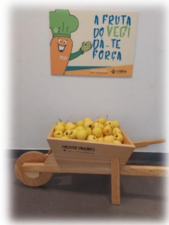
Figura 3: Cesta da Fruta VEGI

Brevemente, esta ação será alargada a todas as escolas de 2º/3ºciclo e secundário, sendo distribuídas as respetivas cestas de frutas VEGI, e realizada a necessária articulação com as direções/coordenações das escolas.